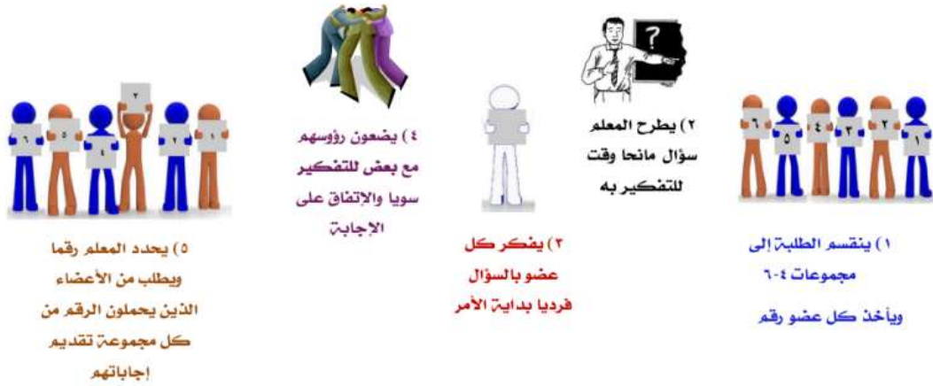
شكل (2.1): نموذج مبسط لخطوات استراتيجية الرؤوس المرقمة